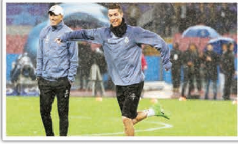
رونالدو باق في ريال لعامين إضافيين أو ثلاثة

أكد لغرب الفرنسي لريال مدريد الإسباني زين الدين زيدان من الولايات المتحدة حيث يستعد فريقه للموسم الجديد، من التمتع باللاعب الإسباني رونالدو باق مع النادي الملكي لعامين إضافيين أو ثلاثة، وأضفاً بذلك حداً للشائعات التي تتحدث عن إمكانية عودته إلى فريقه السابق مانشستر يونايتد الإنكليزي. وقال زيدان عشية اللقاء الودي مع يوفينولد بالذات أنه: "كان هناك الكثير من الحديث للمتلعب بكريستيانو، بأنه يريد الرحيل، أننا نؤمن بشيء واحد - كل مرة تحدث فيها إليه، كان مسترخياً". وواصل: "إنه في عطلة وسيكون معنا في الخامس (من أ ب/ أغسطس)، أنا أسمع، كما كل الناس، لكن الأمر الوحيد الذي يهمني هو ما يريد أبلغنا به في ريال مدريد، سيكون معنا يوم الخامس وأعتقد أنه سيبقى للعامين أو الثلاثة للتحقق له معنا". ويخوض ريال مدريد الأربعاء المقبل مباراة ودية أخرى ضد مانشستر سيتي في لوس أنجلوس ثم يواجه غريميه ليدلج برشلونه السبت في ميامي قبل عودته وريال إلى صفوفه.