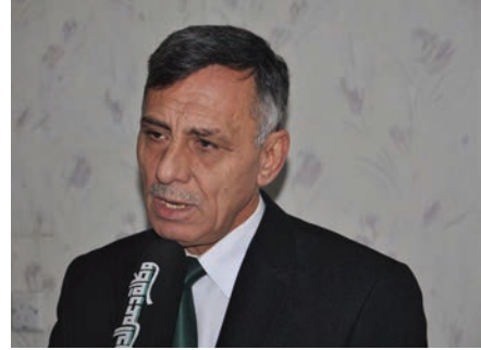
وكالة دعم الدولة/ تحرير الدراجي تصوير/ عبد المحسن الدراجي

اكّد الدكتور سعد عبود الامين العام لكتلة دعم الدولة: اننا ندعم ونؤيد ما دعا اليه رئيس ائتلاف دولة القانون الاستاذ نوري المالكي من احترام التوقيتات الدستورية لاقامة الانتخابات والالتزام بها من قبل كل القوى السياسية. مبينا في تصريح خاص لوکالة دعم الدولة: اننا نلاحظ في الفترة الاخيرة ان بعض القوى والاحزاب السياسية وخصوصا من المكون السني يسعون الى التأجيل وذلك من اجل تسويق انفسهم مرة ثانية بعد الاخفاقات الكبرى التي تعرضوا لها بسبب المواقف السلبية التي قاموا بها وترك مدنهم واهلهم بعد دخول داعش اليها