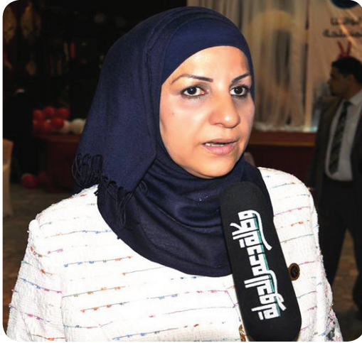
النشاطات والفعاليات المختلفة.

وصنعوا الامن والامان والاستقرار. موضحة: ان مؤسسة دار النور ستواصل دعمها ومساندتها لمجاهدينا الأبطال بكل ما تملك من وسائل. وانها تبارك لابناء شعبنا العراقي الانتصارات وتتمنى لهم المزيد من التقدم والازدهار وتحقيق النهضة الاقتصادية والصناعية وباقي المجالات. المدير بالذكر ان مؤسسة دار النور لتأهيل الأرامل والايتمام تعد من اهم المؤسسات التي تهتم بالطفولة والشرائح النسوية والارامل والمطلقات وقد قامت بالكثير من