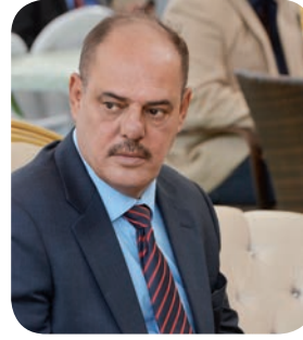
وزارة الداخلية بحاسبة الجهة المعتدية.

أكد رئيس اتحاد الصحفيين العرب ونقيب الصحفيين العراقيين الأستاذ مؤيد اللامى: سنتابع حادثة الاعتداء على كادر العهد ولن نهدأ الا ان يكون المعتدون خلف القضبان. ورفض اللامى الاعتداء الذي تعرض له كادر قناة العهد وطالب