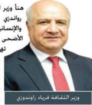
وزير الثقافة فرياد راوندزوري

هنا وزير الثقافة والسياحة والآثار فرياد راوندزوري العراقيين والأمة الإسلامية والإنسانية جمعاء لمناسبة حلول عيد الأضحى المبارك. وقال وزير الثقافة في تهنئته: «نبارك للشعب العراقي والأمة الإسلامية والإنسانية جمعاء حلول عيد الأضحى المبارك. سائلين المولى تعالى أن يمن على شعبنا المجاهد الصابر بالأمن والأمان. وأن يؤيد قواتنا المسلحة والحشد الشعبي والبشمركة وأبناء العشائر الغياري بنصر مؤزر على قوى الإرهاب والظلام. وأن يعيد حجاجنا إلى أرض الوطن سالمين غانمين».