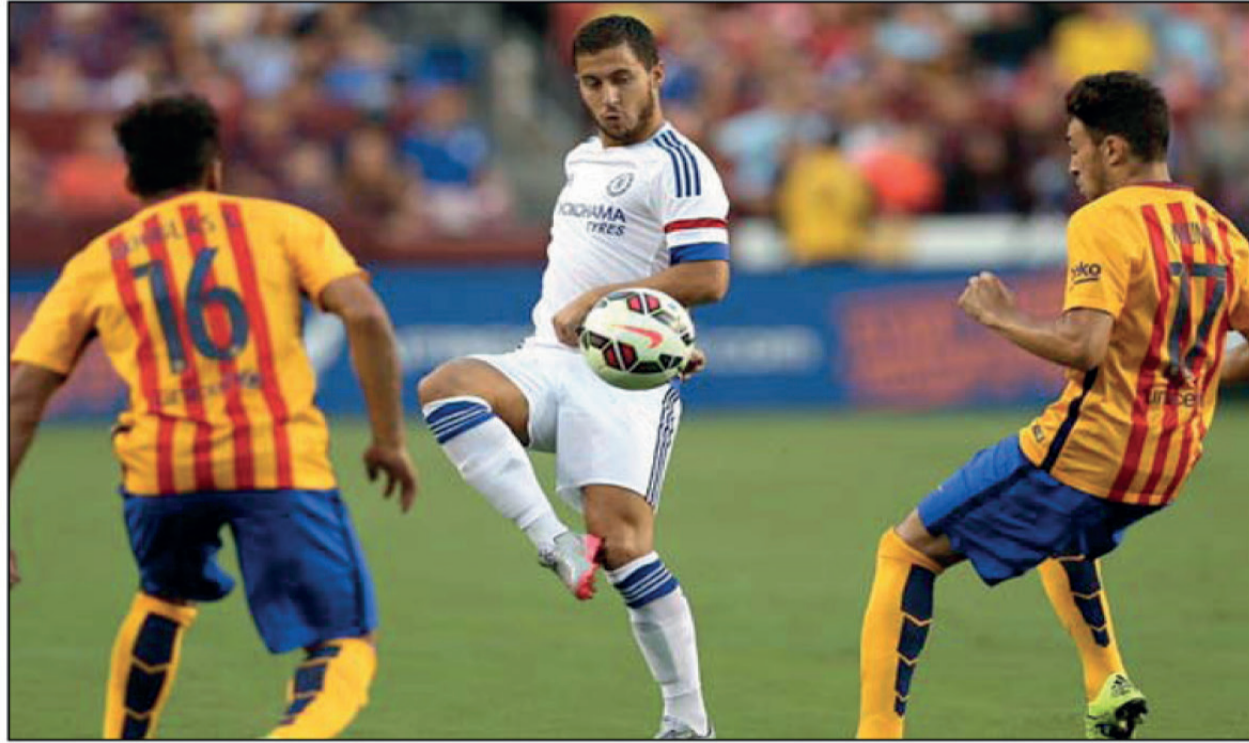
تشيلسي يحسم جولته الدولية مع برشلونة عبر ركلات الجزاء.

فاز تشيلسي ببطولة الدوري الإنكليزي لكرة القدم على برشلونة الإسباني بركلات الترجيح ٤-٢ بعد تعادلهما في الوقت الأصلي ٢-٢ في واشنطن ضمن كأس الأبطال الدولية التي تدخل في إطار جولتها الأميركية التحضيرية للموسم المقبل.