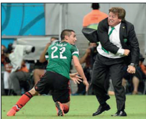
الدرب ميغيل هيريرا

ودافع هيريرا - الذي قاد المنتخب المكسيكي للفوز بلقب كأس الذهبية بعد التغلب على نظيره الجامايكي في المباراة النهائية للبطولة- عن نفسه مؤكداً أن الواقعة ليست سوى مشادة وأنه دفع الصحفي فقط.