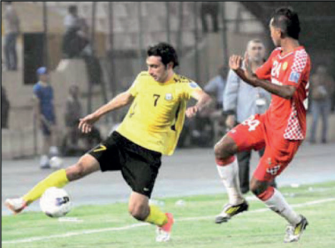
مكورد مسكب كبير لكرة الزوراء، سيكوتان إضافتين قويتين الى صفوف الفريق الى جانب اللاعبين الآخرين الجدد الذين انضموا مؤخراً من الاندية الأخرى للاعبين الذين دفعوا عن الواه في الموسم الماضي.

المدرب باسم قاسم على ملعب الشاذلية كونه مرتبطاً مع النادي لمدة موسمين متتاليين وهو أمر لم يكن يعرفه علاء إلا بعد الاتصال به من قبل إدارة النادي بعد سماعنا توقيعه عقداً رسمياً مع إدارة نادي الكهرباء الرياضي للعب في صفوف فريقها الكروي. وأشار الى أن إدارة النادي قررت أن يلتحق لاعبو الفريق الأول لكرة القدم الذين يتم دعوتهم الى صفوف المنتخب الوطني قبل ٧٢ ساعة على الأقل من موعد المباراة الودية أو الرسمية التي تخوضها تلك المنتخبين استعداداً الى التعليمات والضوابط التي تم وضعها من قبل الاتحاد الدولي باللعبة بخصوص (أيام فيفا) التي أقرها لاعوام الأربعة المقبلة للمحولات والسدورات التي يشرف على إقامتها وكذلك البطولات القارية والإقليمية المعروفة بها دولياً.