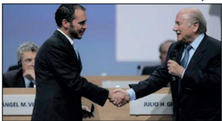
دعم عراقي كبير لترشيح ابن الحسين لرئاسة (فيفا)

مباراة سوريا التي كان من المقرر اجراؤها يوم ٢ حزيران الماضي. وأوضح أن لعلي بن الحسين فضلاً كبيراً على الكرة العراقية بعد أن فتح ابواب الملاعب الأردنية لاحتضان مباريات المنتخبين والأندية العراقية في إقامة مبارياتها الودية والرسمية ضمن البطولات العربية والآسيوية والدولية فضلاً عن احتضان المعسكرات التدريبية نتيجة للحظر المفروض عليها من قبل الاتحاد الدولي باللعبة ، مبرهاً أمره في أن يكون للعب وقفة مشرفة الى جانبه في الانتخابات الجديدة لرئاسة (فيفا) حتى يكون لنا صوت دسموع بقوة داخل المكتب التنفيذي الذي يضم اربع شخصيات عربية في الدورة الشخصية بالمعدل شخصيتين من قارة آسيا (سلمان بن ابراهيم واحمد الفهد) ومثلهما من قارة أفريقيا (هاني بوريوة ومحمدر وراة).