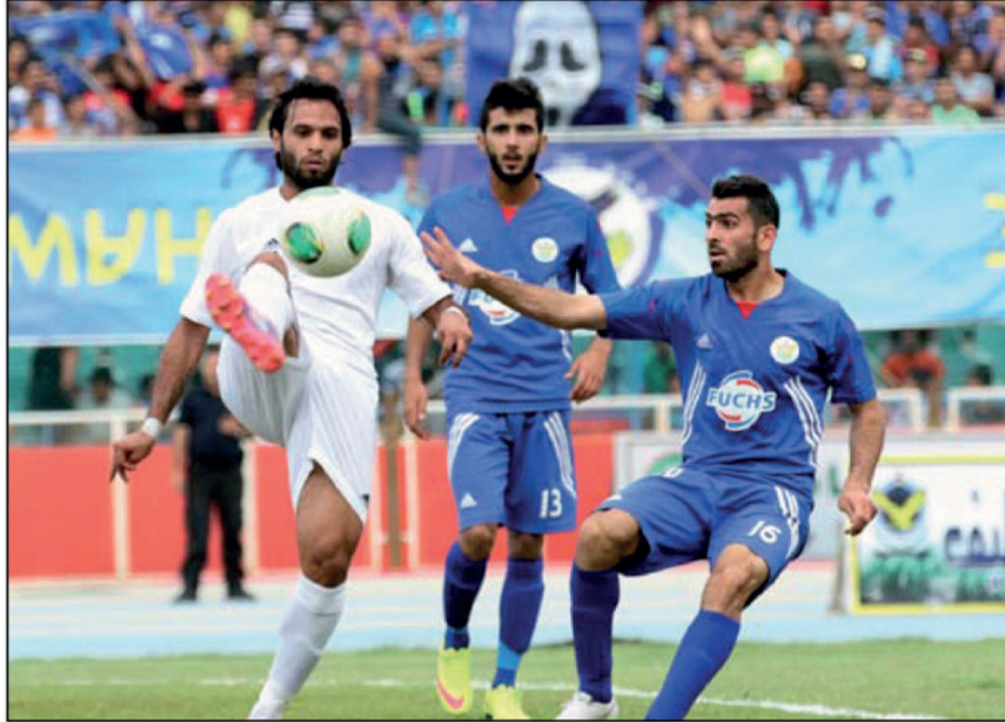
اتحاد الكرة يثير جدلاً واسعاً بخصوص آلية الدورة الجديدة