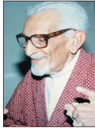
مات مهملاً ومنسياً

مصطفى جواد ليخبره ان "الباشا" قد ادار موجة الاذاعة ليجد فيها هذا المنولوج الراديو قائلاً: شوف هذا ابن..... ديشتمني.